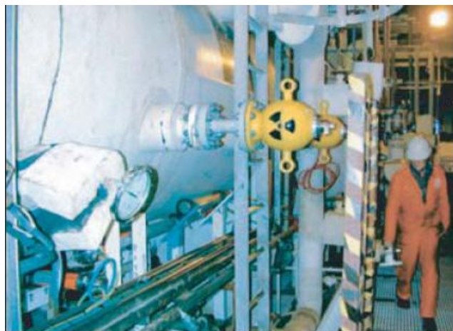
Obr. 2 Radiometrický princip měření výšky hladiny

Odborníci na měření výšky hladiny přišli také s bezdotykovým systémem měření přímo vyzařujícím radarem. Hodí se ke kontinuálnímu měření výšky hladiny především práškového nebo kusového sypaného materiálu. Citlivost nasazených radarových senzorů je tak velká, že se uplatní i u sypkých látek, které mají většinou špatné odrazové vlastnosti. Vzhledem k měřicímu dosahu až 70 m lze bez problémů použít i ve velkých zásobnících. Typickou oblastí použití jsou vysoká sila s velmi prašným sypkým materiálem, jako jsou surovinová moučka nebo krmivo.