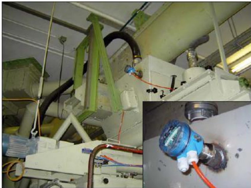
Obr. 5 Soliphant T reguluje tok látky v prívode ke šnekovému dopravníku

Snímače hladiny a spínače hladiny Endress+Hauser – limitné spínače – vibračné spínače Soliphant ::vibračné spínače ::vibračné vidličky ::vidličkové spínače ::spínače pre sypké materiály ::sypké hmoty