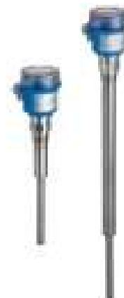
Obr. 1 Spínače Soliphant T pro hlídání výšky hladiny sypkých látek

Vibrační spínače Soliphant (obr. 1) pro sypké látky firmy Endress+Hauser si v minulých letech získaly pevné místo na trhu. Prosadily se zejména díky možnosti univerzálního použití. S novým typem Soliphant T FTM20/21 změnila firma Endress+Hauser směr, neboť se jedná o spínač s jednou tyčí, který je zvláště vhodný k signalizaci výšky hladiny pevných látek, jako jsou obilí, kávová zrna, cukr, krmiva, rýže a mnohé další. V odvětví surovin může být Soliphant T nasazen pro měření práškovitých až hrubozrnných sypkých látek každého druhu od sypné hmotnosti 200 g/l (obr. 2). Díky své mechanické konstrukci zaručuje Soliphant T spolehlivé výsledky i v lepivých nebo vlhkých látkách.