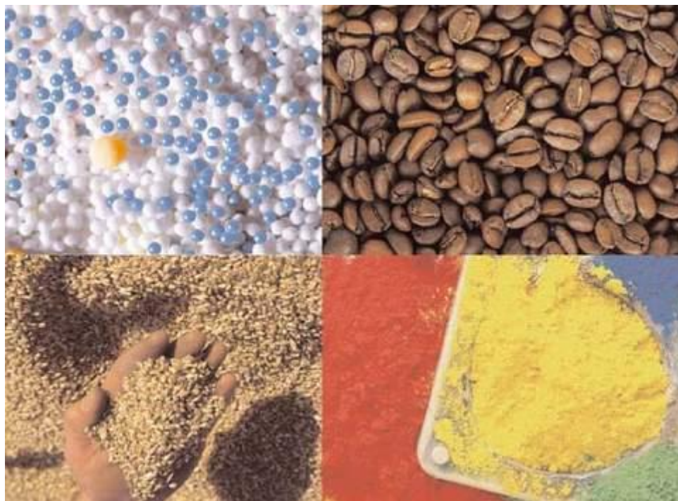
Obr. 2 Látky vhodné pro nasazení spínače Soliphant T