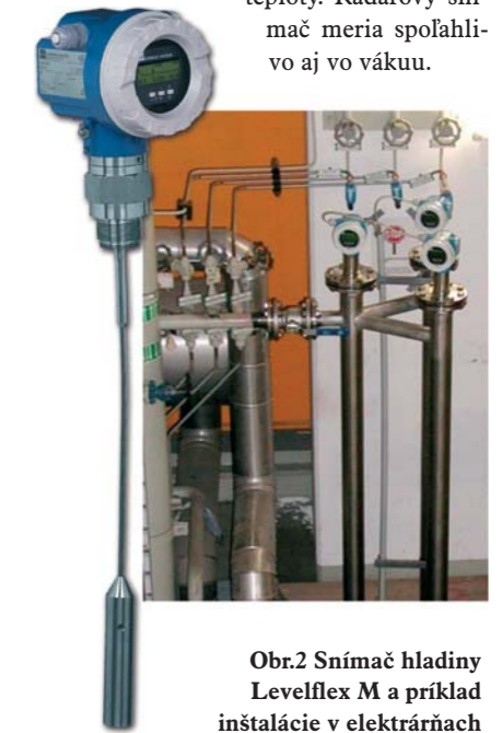
Obr.2 Snímač hladiny Levelflex M a príklad inštalácie v elektrárňach

nie hladiny kotlovej vody sa používa jeden snímač umiestnený v bajpase. Meranie pomocou vysokoteplotného radarového snímača Levelflex M pre teploty až do 400 °C a tlaky do 400 bar je náhradou konvenčného merania pomocou snímača tlakovej diferenciencie, pretože radarové meranie nezávisí od zmeny hustoty, tlaku a ani od zmeny teploty. Radarový snímač meria spoľahlivo aj vo vákuu.