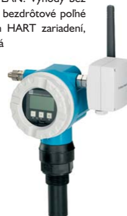
WirelessHART Adapter na rýchle pripojenie existujúceho HART zariadenia do bezdrôtovej siete WirelessHART

WirelessHART komunikačná sieť je zárukou bezpečnosti a spoľahlivosti vďaka integrovanému Safeguard systému. Jednou z jej základných vlastností je redundantné smerovanie Mesh topológie, kde má každé zariadenie v zálohe vždy niekoľko prenosových ciest. Na to slúži sprá-