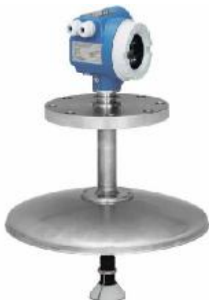
Obr. 3a Hladinoměry Micropilot jsou vybaveny displejem