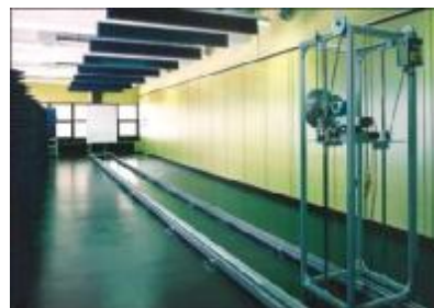
Obr. 4 Kalibrační zařízení společnosti Endress+Hauser pro hladinoměry Micropilot

Radarové hladinoměry Micropilot se snadno uvádějí do provozu v místě měření za pomoci čtyřřádkového displeje, který provádí operátora jednotlivými kroky (obr. 5).