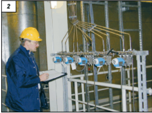
Obr. 2. Vhodné uspořádání a snadno čitelné údaje přístrojů pro ulehčení práce obsluhy

Jedno z použitých uspořádání měřicího řetězce k měření průtoku kapaliny s použitím clony je jako celek ukázáno na obr. 3. Jsou použity souprava Deltaset, dvojitý primární uzávěr a zčásti izolované impulsní potrubí. Vedení impulsního potrubí ve spádu je zárukou jeho trvalého zaplnění. Odvzdušňuje se pomocí pěticestranné ventilové soupravy.